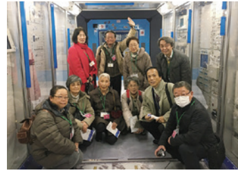
「きぼう」日本実験棟内にて

現役の職員である三輪田会長に案内をして頂いた。「40年前に私が初めて配属されたのがこのH1ロケットのプロ