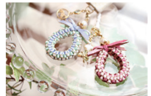
リボンワークレッスンでかわいいチャームを作りましょう。(7/13開催)

◆エビスビール見学、リボンチャーム作り、日銀見学など新しい企画をはじめ、今年度も楽しい行事が盛り沢山です。受付開始日にご注意いただき、皆様お誘い合わせの上、お申込みください。